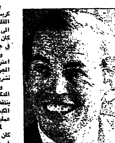
يث سمي في جو سمي

بون - رويتر - قال البروسور كريستيان بارنارد جراح عمليات زرع القلب في جنوب أفريقيا ان التقدم في عمليات القلب افرجه ربما كان سببه ان هذه العمليات جرت في جنوب أفريقيا . وكان البروسور بارنارد يرد على اعتراضات من البروسور نيرن فورس الجراح الالمانى الذى فاز بجائزة نوبل لشرفها صفة فيلث ام سوانج . وقال البروسور بارنارد ان هذا يتقدم في وقت زرع القلب ولا يتقدم عمليات الزرع الاخرى التي تخالفت الكبد والكلية وعليا ان نعمل تماما ان عملية زرع الكبد مهمة كعملية زرع القلب لذا ان ننتقد زرع القلب .. ربما كان السبب ان العملية الاولى اجريت في جنوب افريقيا ؟